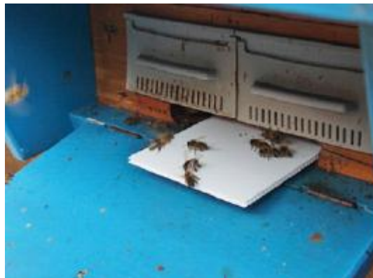
Schäfer-Diagnosefalle in Magazin Schweizer Kasten (links) und Bienenhaus (rechts)